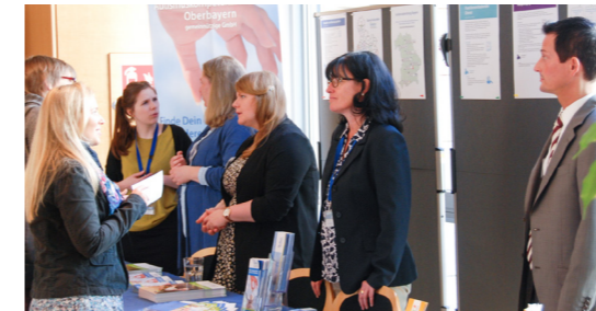
autkom Tagungsstand 2016

Mit viel Engagement hat autkom bereits am Anfang ein Qualitätsmanagementsystem eingeführt, das die Arbeit nachvollziehbar macht und eine fortlaufende Verbesserung der Angebote zum Ziel hat. Die positiven Rückmeldungen der jährlich durchgeführten Klienten-Befragungen bestätigen die zuverlässigen und mit hoher Qualität angebotenen Dienstleistungen.